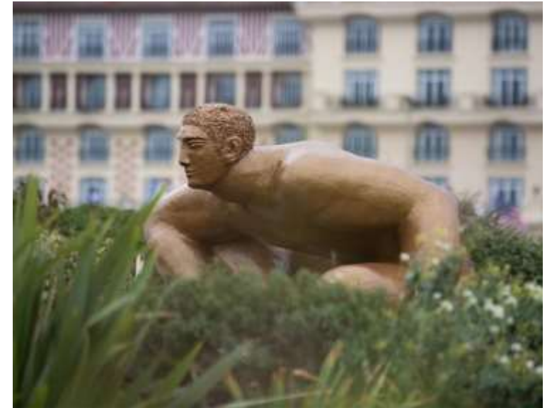
“Le guetteur”, Deauville, Calvados